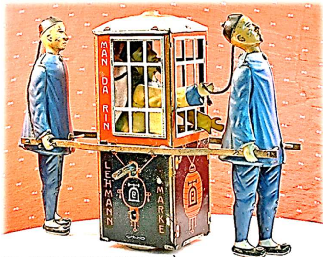
EPL 565 MANDARIN (1905-1941)